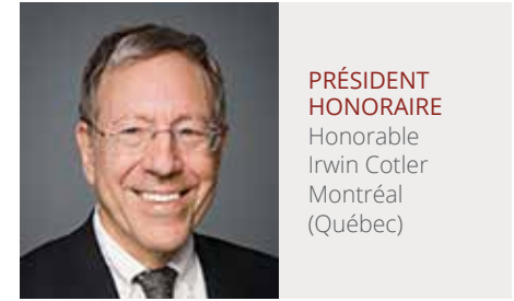
PRÉSIDENT HONORAIRE Honorable Irwin Cotler Montréal (Québec)