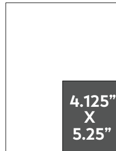
Quart de page